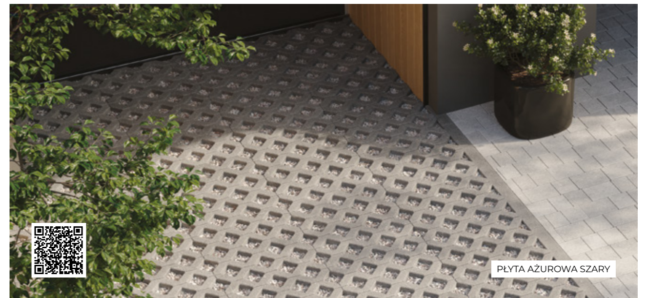
PŁYTA AŻUROWA SZARY