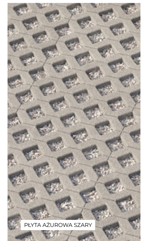
PŁYTA AŻUROWA SZARY