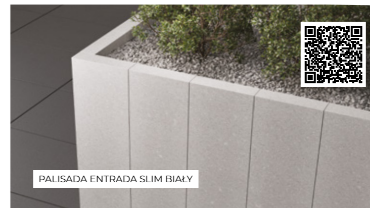
PALISADA ENTRADA SLIM BIAŁY