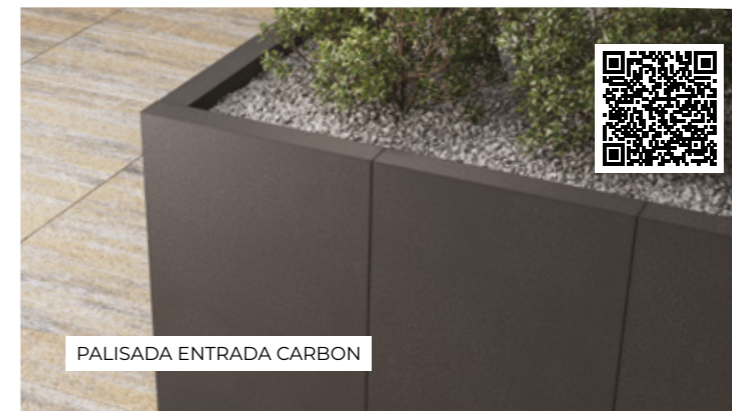
PALISADA ENTRADA CARBON