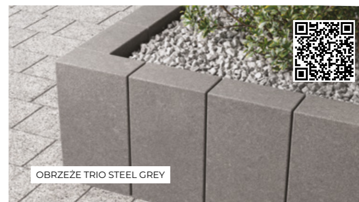
OBRZEŻE TRIO STEEL GREY