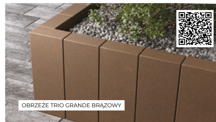
OBRZEŻE TRIO GRANDE BRĄZOWY