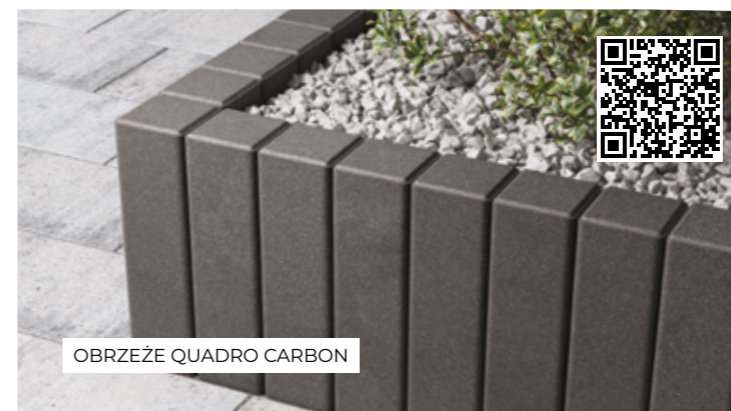
OBRZEŻE QUADRO CARBON

Ilość sztuk na warstwie: A - 22 / B - 20 / C - 16