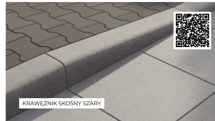
KRAWĘŻNIK SKOŚNY SZARY

Ilość sztuk na warstwie: A - 4 / B - 4 / C - 4 / D - 4 / E - 4 / F - 4