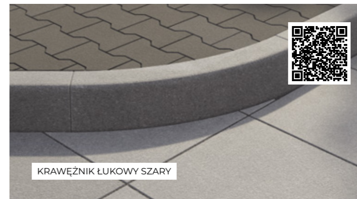
KRAWĘŻNIK ŁUKOWY SZARY