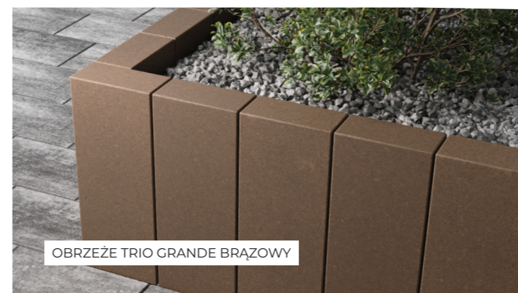
OBRZEŻE TRIO GRANDE BRĄZOWY