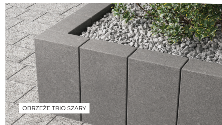
OBRZEŻE TRIO SZARY