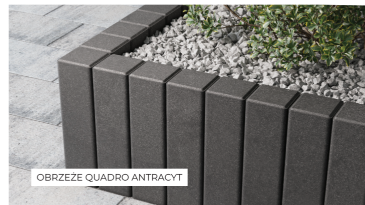
OBRZEŻE QUADRO ANTRACYT

Ilość sztuk na warstwie: A - 22 / B - 20 / C - 16