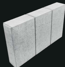
Obrzeże dekoracyjne Trio